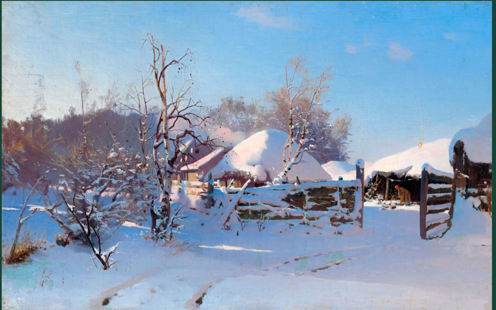
Н.Н. Дубовской «Зимняя деревня»