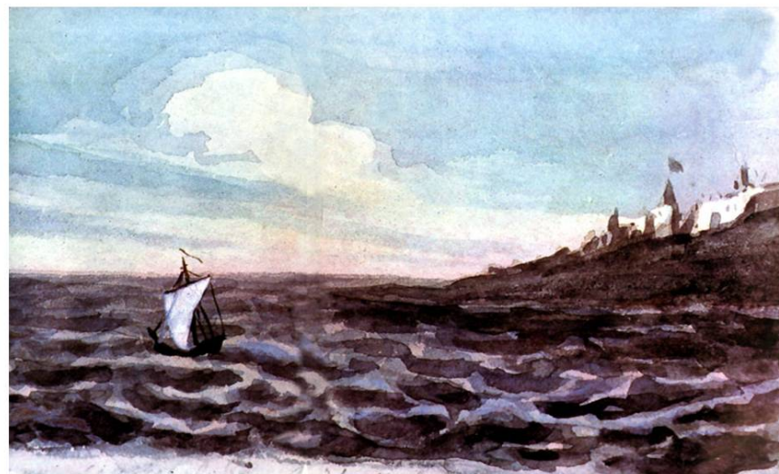
«Парус». Акварель Лермонтова.

Под ним струя светлей лазури, Над ним луч солнца золотой... А он, мятежный, просит бури, Как будто в бурях есть покой!